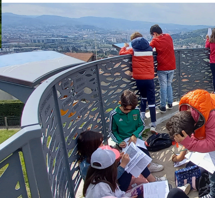
TABLE D'ORIENTATION DU CRÊT